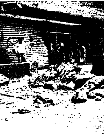
الجرارة ترفع اكياس الرمل في الشياح

دعا « الشباب الزحاي » في نداء الى اهالي زحلة والبقاع امس ، الى ازالة جيع المظاهر المسلحة وسياسة العنف والاضرام بالشارع الاجتماعي وانصاف المحرومين .. وتجاه في النداء : ان الضواك الالية التي عاشها المنطقة ، تتناقى مع تقاليد اللبنانيين في التعاون والتفاني والاخوة والحياء ، ولا بد ان يكسر صوت القطن فوق كل صوت .. المشرك .. وتجاه في النداء : ان الضواك الالية التي عاشها المنطقة ، تتناقى مع تقاليد اللبنانيين في التعاون والتفاني والاخوة والحياء ، ولا بد ان يكسر صوت القطن فوق كل صوت .. المشرك ..